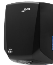
AA56600-MT 8427950367427 Acabado Negro Mate