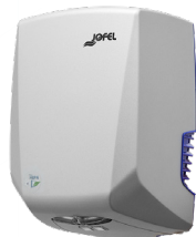
AA56300 8427950367380 Acabado Plata