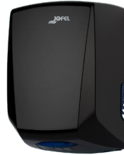
AA56600 8427950367427 Acabado Negro