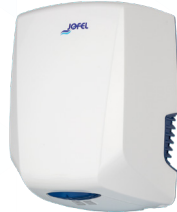
AA56000 8427950367342 Acabado Blanco