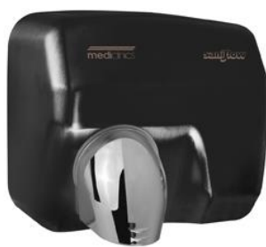
E05AB Acabado negro mate