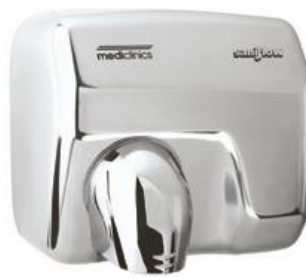
E05AC Acabado brillante