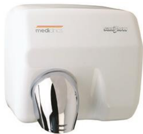
E05A Acabado blanco