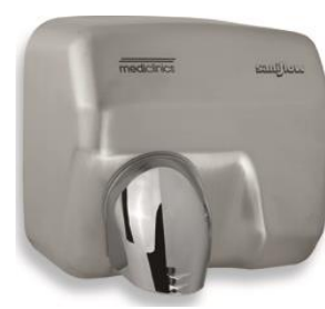
E05ACS Acabado satinado