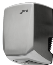
AA57500 8427950367540 Acabado INOX satinado