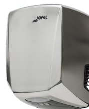
AA57000 8427950367502 Acabado INOX brillo